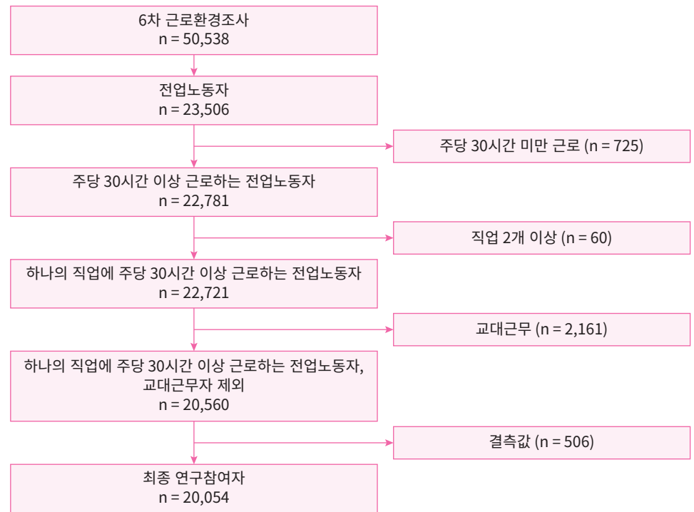
Fig. 1. 연구대상자의 선정.

해 각각의 증상별로 하위 질문이 조사되었다: A) 요통(허리통증); B) 어깨, 목, 팔, 팔꿈치, 손목, 손 등 상지 근육통; C) 엉덩이, 다리, 무릎, 발 등 하지 근육통.